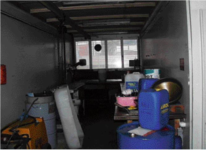
Bild 3: Alltäglicher Mehrzweckraum – kann Auslöser für verschiedene Gefahren sein.

werden zehntausenden Betrieben Erleichterungen bringen. Die verfügbaren Mittel können so dort eingesetzt werden, wo sie den grössten Nutzen bringen und dafür sorgen, dass die Unfallzahlen sinken. Deshalb erwarten wir von der revidierten Richtlinie einen neuen Schub zur Förderung von Arbeitssicherheit und Gesundheitsschutz.»